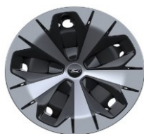
19" oceleové disky s celoplošnými aero. krytmi