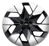
20" zliatinové disky šedá Magnetic Línia výbavy Premium