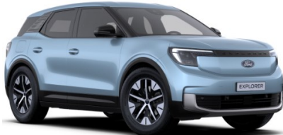
Arctic Blue metalická