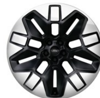
21" zliatinové disky čierna Asphalt Matt Voliteľne