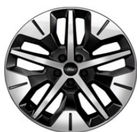
19" zliatinové disky čierna Absolute Línia výbavy Explorer