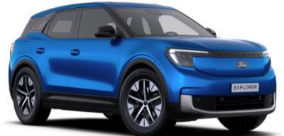
Blue My Mind prémiová metalická