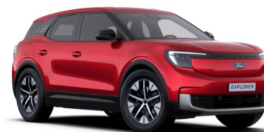
Lucid Red prémiová metalická