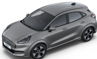
Solar Silver metalická