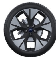
19" disky z ľahkej zliatiny Voliteľná výbava D2VCA