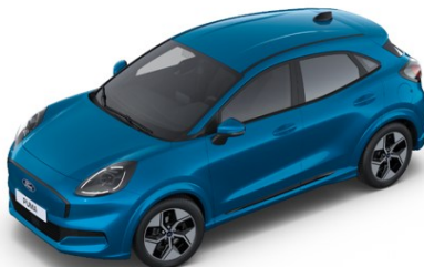
Digital Aqua Blue metalická