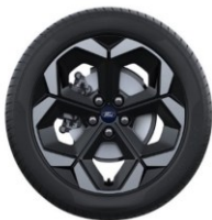
18" disky z ľahkej zliatiny Štandardná výbava Puma Premium