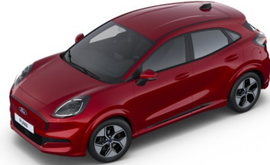
Fantastic Red metalická