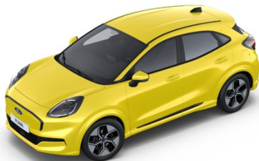
Electric Yellow metalická