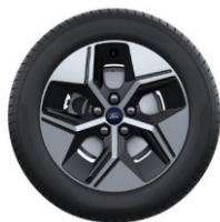
17" disky z ľahkej zliatiny Štandardná výbava Puma Gen-E